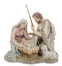
Б) Рождество Христово